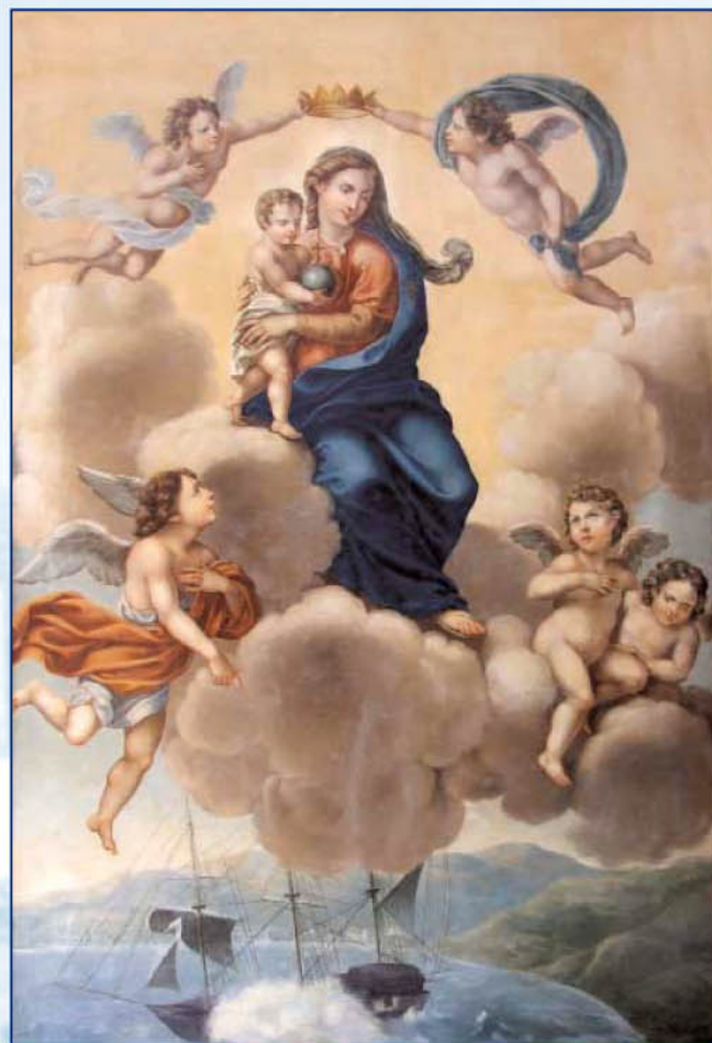
Madonna di Portosalvo